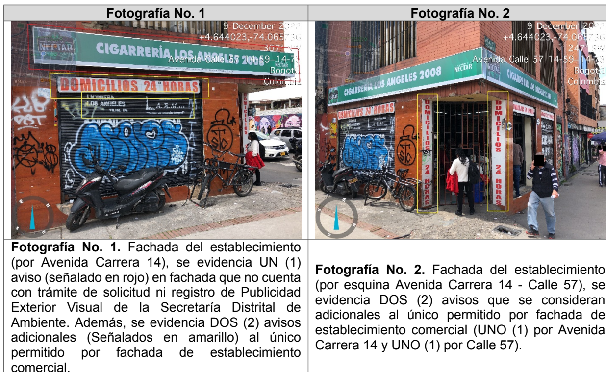
Tabla 3. Registro fotográfico

Valoración técnica y conductas generales evidenciadas (Ver Anexo No. 1. Acta de Visita No. 205616).